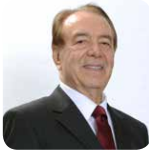
Ali Akın Tari Yönetim Kurulu Başkan Yardımcısı

(1944 - Denizli) Ahmet Nazif Zorlu, kariyerine tekstil sektöründe aile şirketinde başladı. İlk şirketi olan Korteks'i 1976 yılında kurdu. İzleyen yıllarda tekstil sektöründe yeni yatırımlara imza atan Ahmet Nazif Zorlu, 1990 yılında Zorlu Holding'i kurdu. 1994 yılında Vestel markasını satın alan Ahmet Nazif Zorlu, Vestel Beyaz Eşya San. ve Tic. A.Ş. ile Vestel Elektronik San. ve Tic. A.Ş. başta olmak üzere, halen farklı sektörlerde hizmet veren Zorlu Grubu bünyesinde yer alan birçok şirkette Yönetim Kurulu Başkanlığı'nı veya Üyeliğini sürdürmektedir.