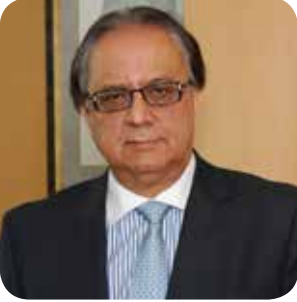
Enis Turan Erdoğan İcra Kurulu Başkanı

(1955 - Mersin) Enis Turan Erdoğan İ.T.Ü. Makina fakültesini 1976 yılında bitirdi. 1979'da İngiltere'de Brunel Üniversitesi'nde İşletme Master'ı yaptı. Türkiye'ye döndükten sonra özel sektördeki çeşitli şirketlerde yöneticilik yapan Turan Erdoğan 1988 yılında Vestel'e katıldı. 1988'ten bu yana Vestel'de çeşitli yöneticilik pozisyonlarında görev yapan Turan Erdoğan, 1 Ocak 2013'ten itibaren Vestel Şirketler Grubu İcra Kurulu Başkanı olarak görev yapmaktadır. Turan Erdoğan 2002 -2006 yılları arasında TURKTRADE Başkanlığı yapmıştır. Ayrıca Avrupa'nın en büyük ICT Konfederasyonu DIGITALEUROPE'a seçilmiş ilk Türk Yönetim Kurulu Üyesidir ve 2010 yılından beri bu göreve devam etmektedir.