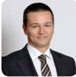
Cem Köksal İcra Kurulu Üyesi

(1955 - Mersin) Enis Turan Erdoğan İ.T.Ü. Makina fakültesini 1976 yılında bitirdi. 1979'da İngiltere'de Brunel Üniversitesi'nde İşletme Master'ı yaptı. Türkiye'ye döndükten sonra özel sektördeki çeşitli şirketlerde yöneticilik yapan Turan Erdoğan 1988 yılında Vestel'e katıldı. 1988'ten bu yana Vestel'de çeşitli yöneticilik pozisyonlarında görev yapan Turan Erdoğan, 1 Ocak 2013'ten itibaren Vestel Şirketler Grubu İcra Kurulu Başkanı olarak görev yapmaktadır. Turan Erdoğan 2002 -2006 yılları arasında TURKTRADE Başkanlığı yapmıştır. Ayrıca Avrupa'nın en büyük ICT Konfederasyonu DIGITALEUROPE'a seçilmiş ilk Türk Yönetim Kurulu Üyesidir ve 2010 yılından beri bu göreve devam etmektedir.