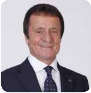
Ahmet Nazif Zorlu Yönetim Kurulu Başkanı

(1944 - Denizli) Ahmet Nazif Zorlu, kariyerine tekstil sektöründe aile şirketinde başladı. İlk şirketi olan Korteks'i 1976 yılında kurdu. İzleyen yıllarda tekstil sektöründe yeni yatırımlara imza atan Ahmet Nazif Zorlu, 1990 yılında Zorlu Holding'i kurdu. 1994 yılında Vestel markasını satın alan Ahmet Nazif Zorlu, Vestel Beyaz Eşya San. ve Tic. A.Ş. ile Vestel Elektronik San. ve Tic. A.Ş. başta olmak üzere, halen farklı sektörlerde hizmet veren Zorlu Grubu bünyesinde yer alan birçok şirkette Yönetim Kurulu Başkanlığı'nı veya Üyeliğini sürdürmektedir.